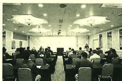
業者さんから現場のご意見も頂戴