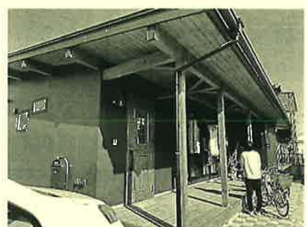
次回、非常時にご活用ください