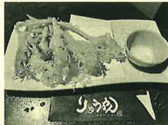
ホクホクのにんにく揚げ