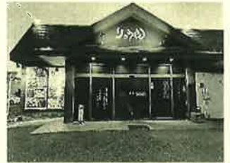
「りゅうやん」 足利市朝倉町3丁目3-2

今回、ご紹介するのは、足利市にある居酒屋「りゅうやん」さん。生ビールはキンキンに冷えた氷点下のスーパードライ。すご〜く美味しいです。サーロイン鉄板ステーキ、玉子焼き、ゆで茶豆、クリスピー生地がパリッパリッのマルゲリータなどなどメニューは豊富で、いつも何を食べようか？迷ってしまいます。宴会もでき、少人数の時は個室もあり、料理の提供が速いのでお気に入りのお店です。店員さんや店長さんの対応が、イイので通ってます。定休日は元旦のみで夕方5時からです。一杯いかがでしょうか？