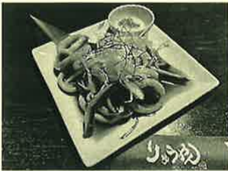
イカのバター醤油焼き