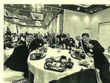
懇親会には豪華ゲストをお招きして