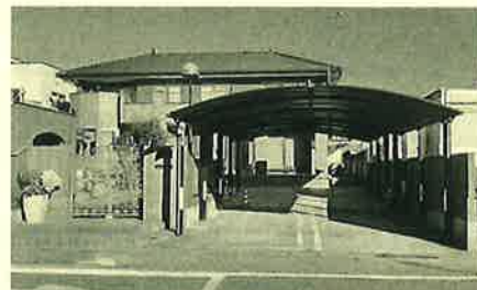
4台分の大きなガレージになりました