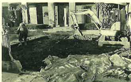
素敵だったお庭の一部を解体