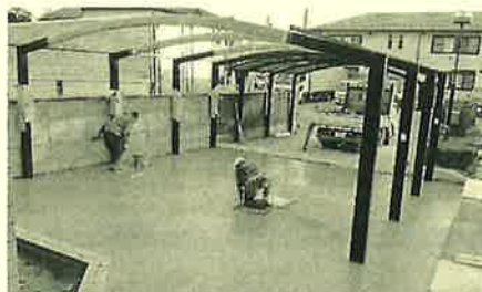
広い面積のコンクリートを丁寧に撫でます