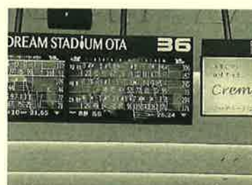
中には200越えの参加者さんも！ とてもかないません。。