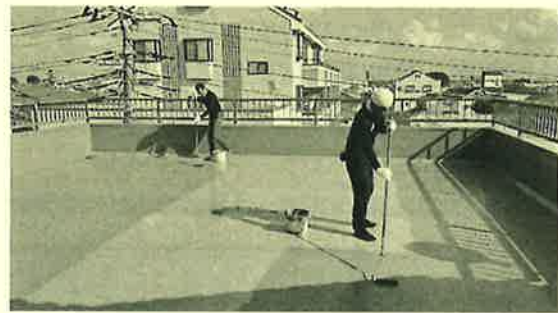
防水工事が完了して、安心して活用できますね