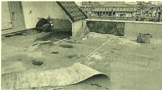
まずは、浮き上がってしまったシートを撤去