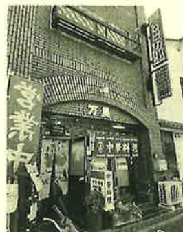
「万里」桐生市本町3丁目5-40