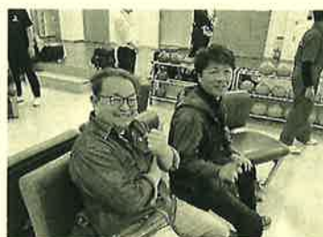
毎年楽しみに参加させて いただいています