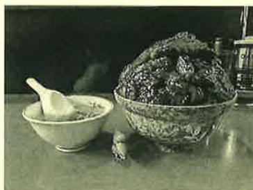
総重量2キロの焼肉丼