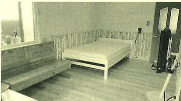
ホワイト基調でおしゃれな北欧スタイルに