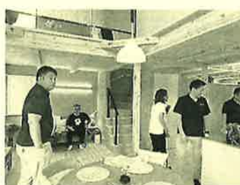
素敵なジャパンディスタイル