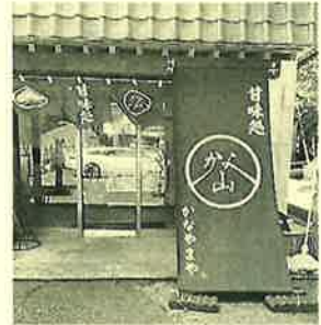
甘味処「かなやまや」 太田市金山町29-10