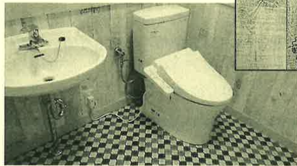
木目調の腰壁には、さりげなくスヌーピーが！