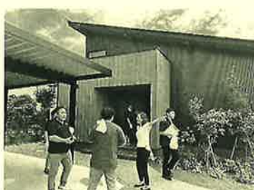
新しいモデルハウスを見学